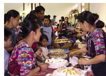
Tourismus Ausbildung JPEG, 7,3 x 5,2 cm, 300 dpi, 0,7 MB