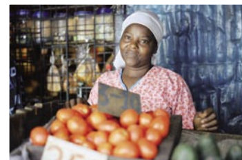
Bio-Kurs für Bauern JPEG, 7,5 x 5,2 cm, 300 dpi, 0,5 MB