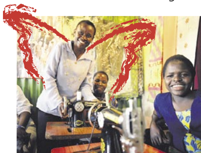
Business Angel JPEG, 7,1 x 5,1 cm, 300 dpi, 0,5 MB

Diese und weitere druckfähige Fotos finden Sie zum Download auf unserer Website www.icep.at unter Kontakt/Presse